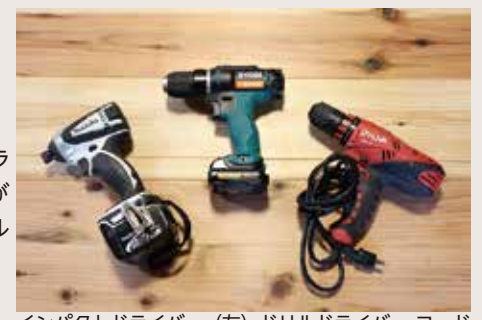
インパクトドライバー(左)ドリルドライバーコードレス(中央)ドリルドライバーコード式(右)